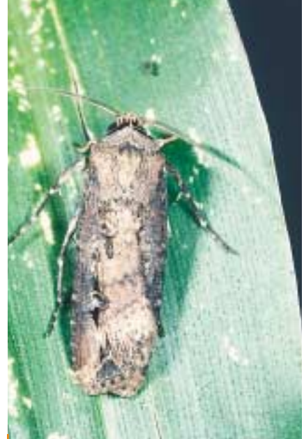
La Noctuelle baignée effectue une migration vers le nord au début de septembre. Sa descendance est observée en octobre, parfois jusqu'en décembre. Cette migration tardive en saison vers le nord peut s'expliquer par le fait que le papillon se place ainsi dans les conditions météorologiques les plus favorables à sa reproduction.