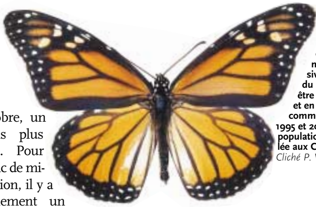
Le Monarque, célèbre pour ses migrations massives en Amérique du Nord, peut parfois être observé en France et en Angleterre, comme ce fut le cas en 1995 et 2001. Il existe une population indigène installée aux Canaries.

octobre, un mois plus tard. Pour le pic de migration, il y a également un mois de décalage entre