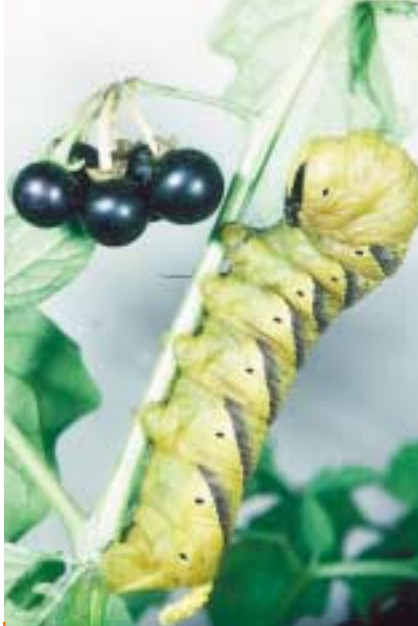
Cette belle chenille est celle du Sphinx tête-de-mort. La découvrir demeure un plaisir rare dans notre pays, surtout dans les départements septentrionaux. 1956 restera comme l'une des années les plus favorables à la migration de ce Sphinx en Europe.

Jusque là, l'étude ne concernait qu'une seule espèce (le Vulcain) et