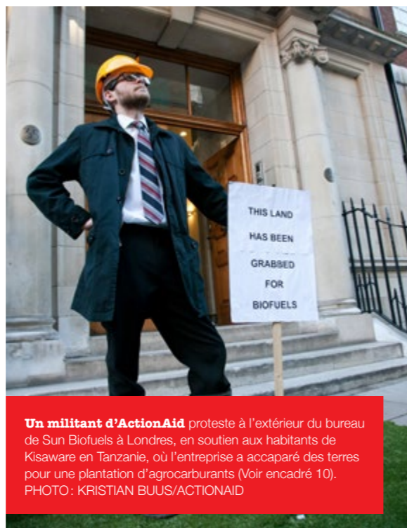
Un militant d'ActionAid proteste à l'extérieur du bureau de Sun Biofuels à Londres, en soutien aux habitants de Kisware en Tanzanie, où l'entreprise a accaparé des terres pour une plantation d'agrocarburants (Voir encadré 10).

(agrocarburants), d'alimentation animale, de pâturages, de fibres, mais aussi la sylviculture, l'exploitation minière, le tourisme, l'industrie et le développement des opérations immobilières. Le bétail et les agrocarburants ont été des moteurs clés. Un tiers des cultures mondiales sont destinées à la nourriture animale, tandis que 13 milliards d'hectares de forêts sont perdus chaque année en vue d'une conversion vers un usage pastoral ou agricole, pour la production d'alimentation animale et de denrées alimentaires 23 . La demande croissante en cultures énergétiques au niveau mondial, ayant pour moteur les quotas pour l'utilisation de bioéthanol et de biodiesel imposés en Europe et aux États-Unis, a aussi nourri l'intérêt porté aux transactions foncières 24 . Un autre vecteur de cette évolution était la situation qui a suivi la crise bancaire et financière. Les institutions financières se sont bousculées pour trouver de nouveaux postes d'investissements