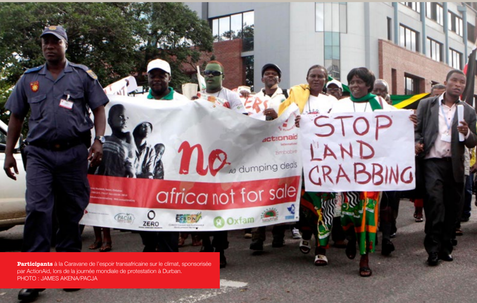
Participants à la Caravane de l'espoir transafricaine sur le climat, sponsorisée par ActionAid, lors de la journée mondiale de protestation à Durban.