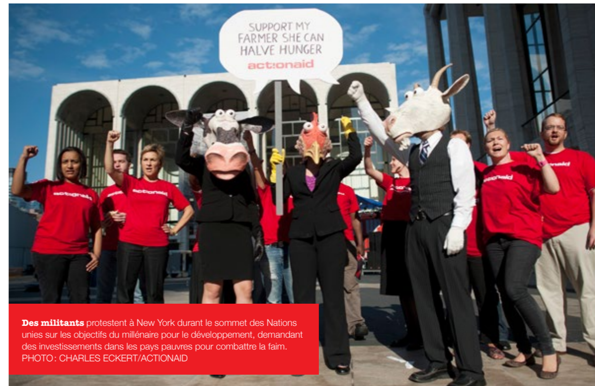
Des militants protestent à New York durant le sommet des Nations unies sur les objectifs du millénaire pour le développement, demandant des investissements dans les pays pauvres pour combattre la faim.

Le groupe français Mimran veut 60 000 hectares pour commencer, puis prévoit à terme d'étendre ses exploitations jusqu'à 182 000 hectares. Une autre firme, l'entreprise algérienne Cevital, rechercherait 300 000 hectares de terres. Le 31 janvier 2013, le directeur du négociant céréalier français Louis Dreyfus, le plus grand importateur de riz en Côte d'Ivoire, a signé un accord avec le ministre ivoirien de l'agriculture lui donnant accès à 100 000 à 200 000 hectares dédiés à la production de riz 57 .