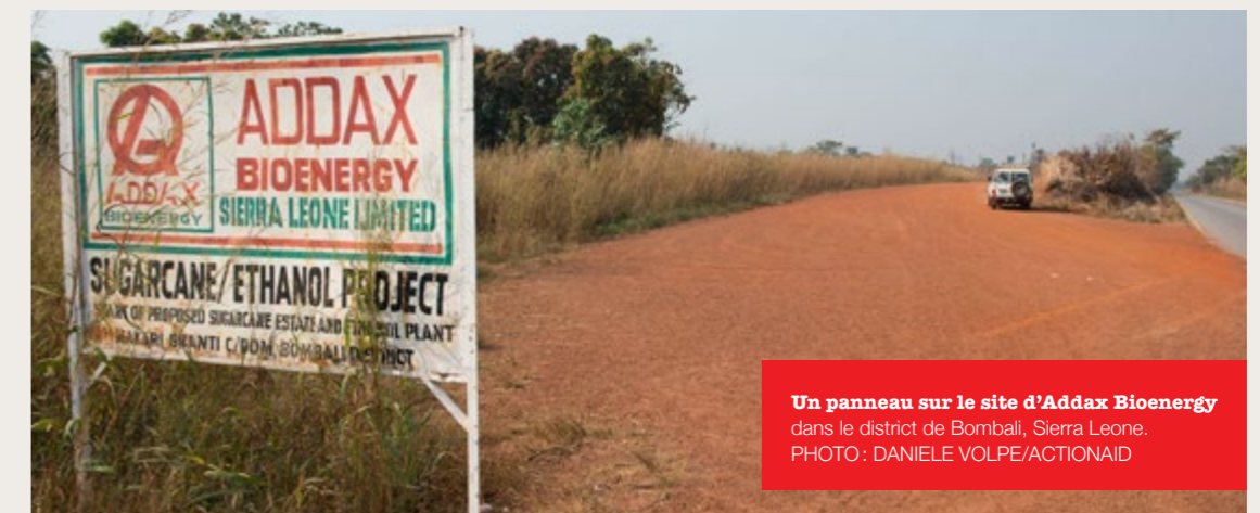
Un panneau sur le site d'Addax Bioenergy dans le district de Bombali, Sierra Leone.

attribuées des qualités intrinsèques de sainteté ou de sacralité, qu'il s'agisse de forêts, de sources, de formations géologiques, ou autre. Quand les transactions foncières sont effectuées et de nouvelles frontières sont tracées sur leurs territoires en assignant de nouveaux droits de propriété à des investisseurs, ce sens et cette valeur culturels sont souvent complètement ignorés. La compensation financière ne peut en aucun cas refléter la valeur de ce que perdent les communautés locales quand ces endroits sont détruits ou annexés, et elle est souvent gravement insatisfaisante, voire insultante. De plus, les transactions foncières, qui ont des