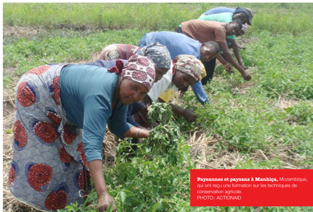
Paysannes et paysans à Manhiça , Mozambique, qui ont reçu une formation sur les techniques de conservation agricole.

On compte parmi les options d'investissement qui pourraient améliorer la durabilité et la résistance au climat : l'amélioration des techniques d'agriculture biologique et à faibles intrants externes, une utilisation de l'eau plus efficace, des contrôles biologiques des éléments pathogènes actuels et émergents, des substituts biologiques aux produits chimiques agricoles, et la réduction de la dépendance du secteur agricole aux énergies fossiles 106 .